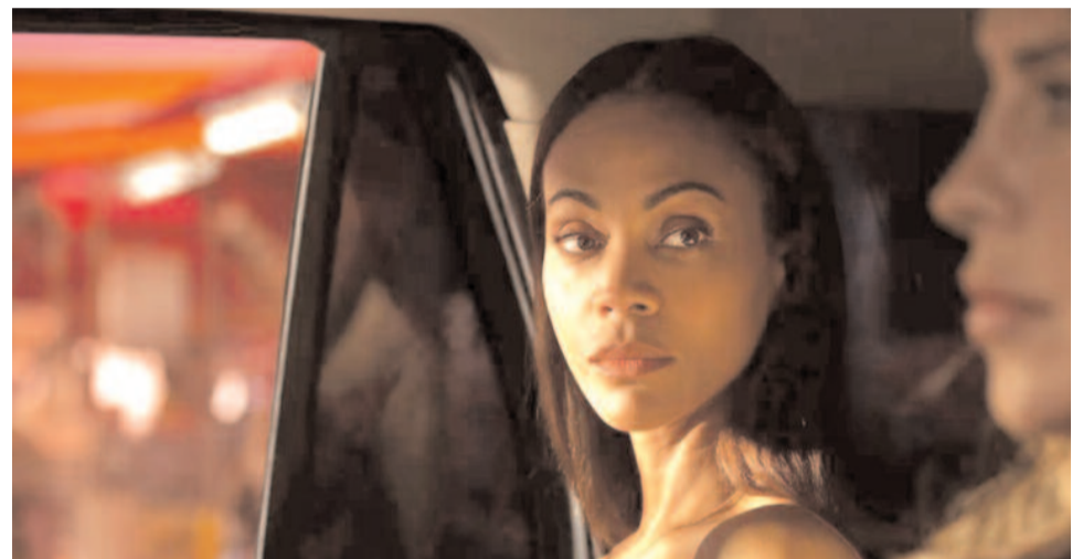
El Festival comenzará, en la sala Astor Piazzolla del Teatro Auditorium con la proyección de "Emilia Pérez" de Jacques Audiard,

torium estarán disponibles por $3000. Todas las entradas estarán a la venta a través de la página web oficial del festival.