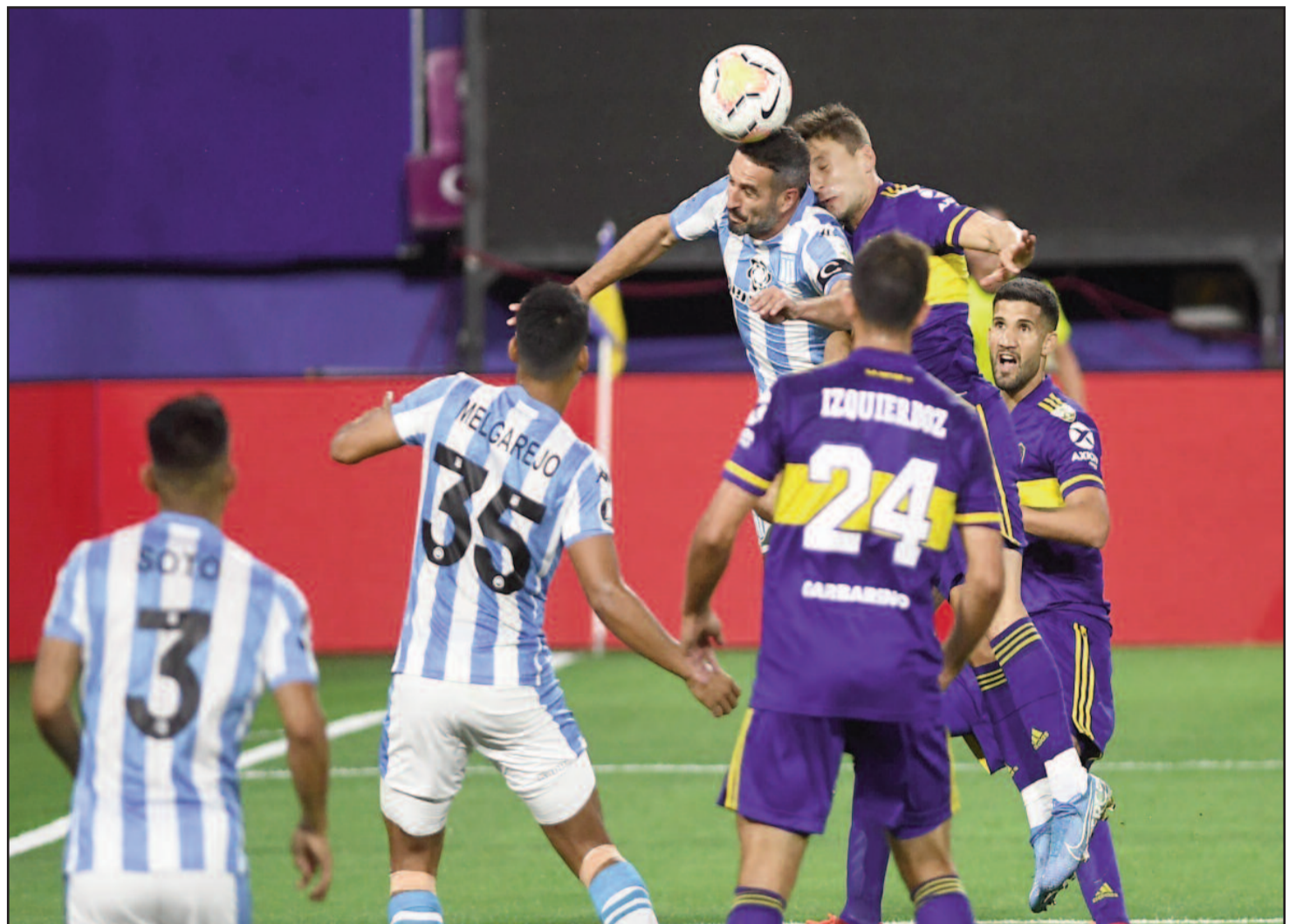
El Xeneize se impuso 2 a 0, sobre la Academia y enfrentará a Santos de Brasil. Salvio y Villa marcaron los tantos del equipo de Russo.

intervenir nuevamente para tapanle un nuevo mano a mano a Soldano. Era impresionante la actuación del uno.