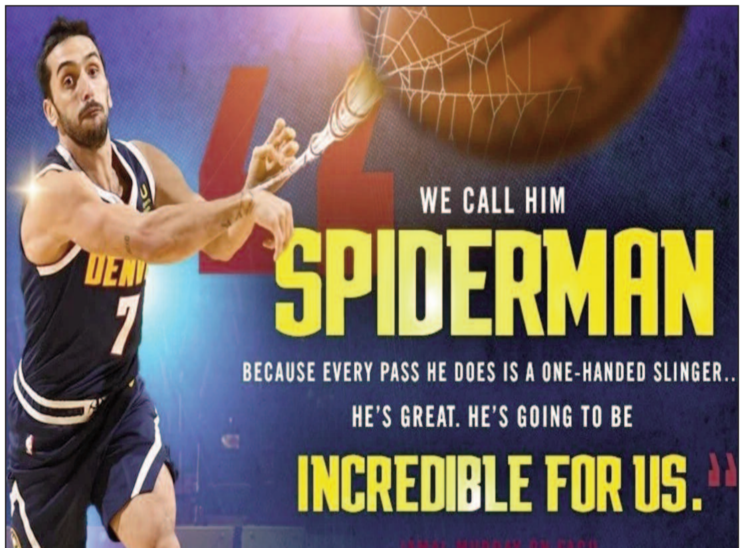
El cartel que hizo Denver Nuggets con Facundo Campazzo y el apodo de Spiderman

El próximo partido para Denver será este viernes nuevamente ante Portland