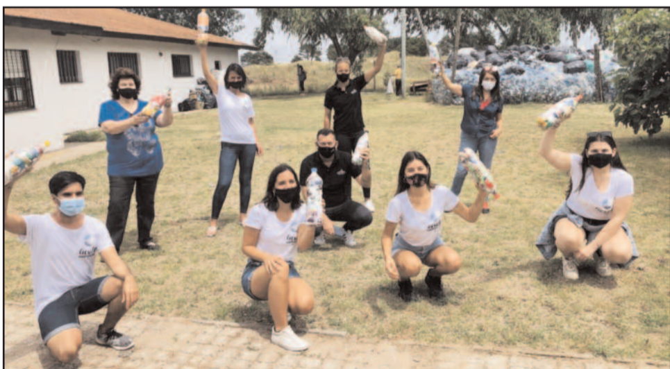
Gallay en la fundación Arco Iris

Por Julián Mozo, para el diario El Atlántico