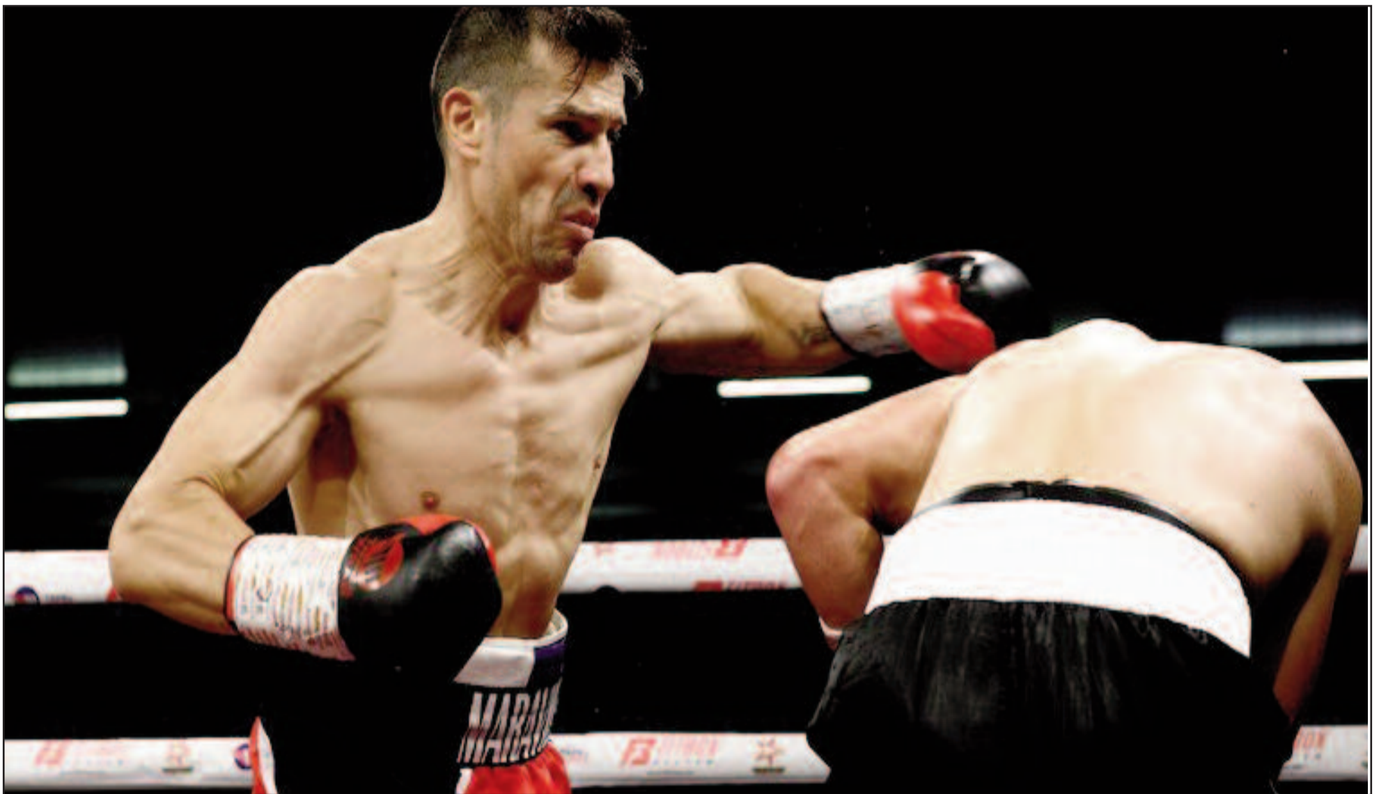
El oriundo de Quilmes protagonizó su segundo combate oficial desde que decidió reactivar su carrera profesional tras pasar más de seis años inactivo

Venció por nocaut técnico al finlandés Jussi Koivula en el noveno asalto en Cantabria, España.