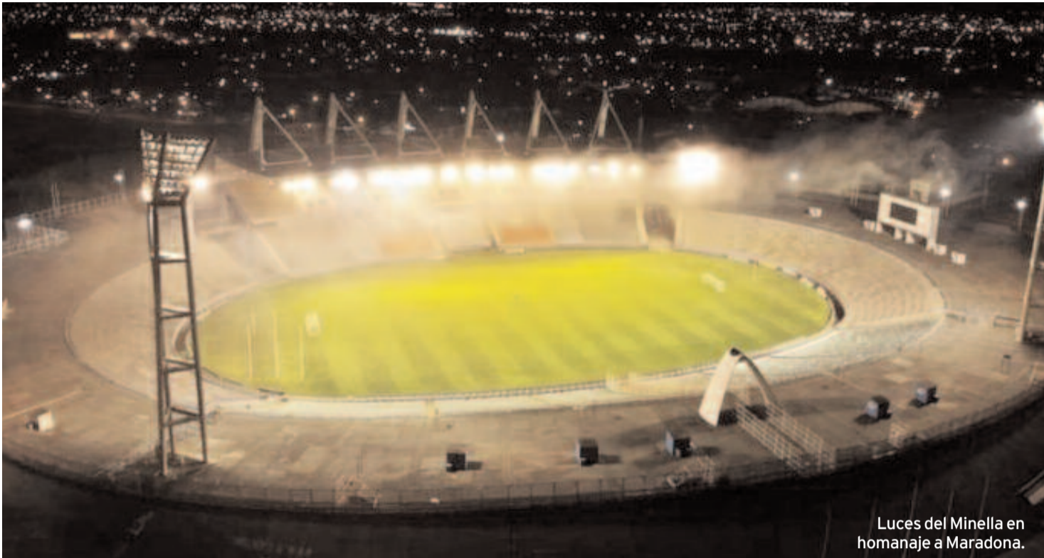
Luces del Minella en homenaje a Maradona.

También a las 10 se encendieron las luces del estadio mundialista, en sintonía con el resto de los estadios del país, los cuales tuvieron “la luz que irradiaba Maradona”.