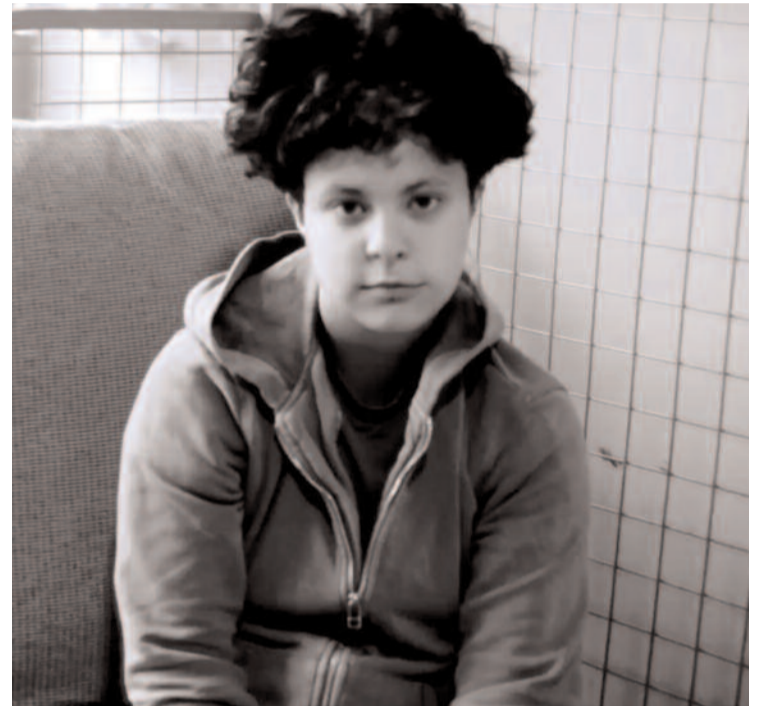
El cortometraje cuenta con la dirección de Agustina Groppa

además de haber ganado un Oscar por el corto «Dear Basketball: la leyenda de Kobe Bryant».