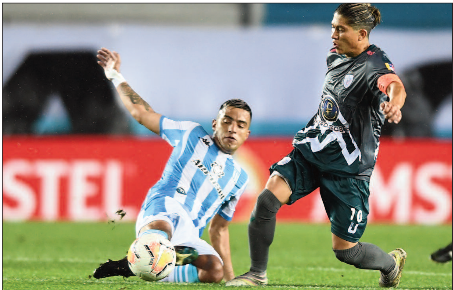
Racing derrotó a Estudiantes de Mérida (Venezuela) por 2 a 1, cerrando el Grupo F de la Copa Libertadores.

Nacional (+6) y Racing (+5) 15 puntos, Estudiantes de Mérida 4 y Alianza Lima 1. El viernes se conocerá el rival del elenco de Beccacece tras el sorteo de los octavos de final de la Copa Libertadores 2020.