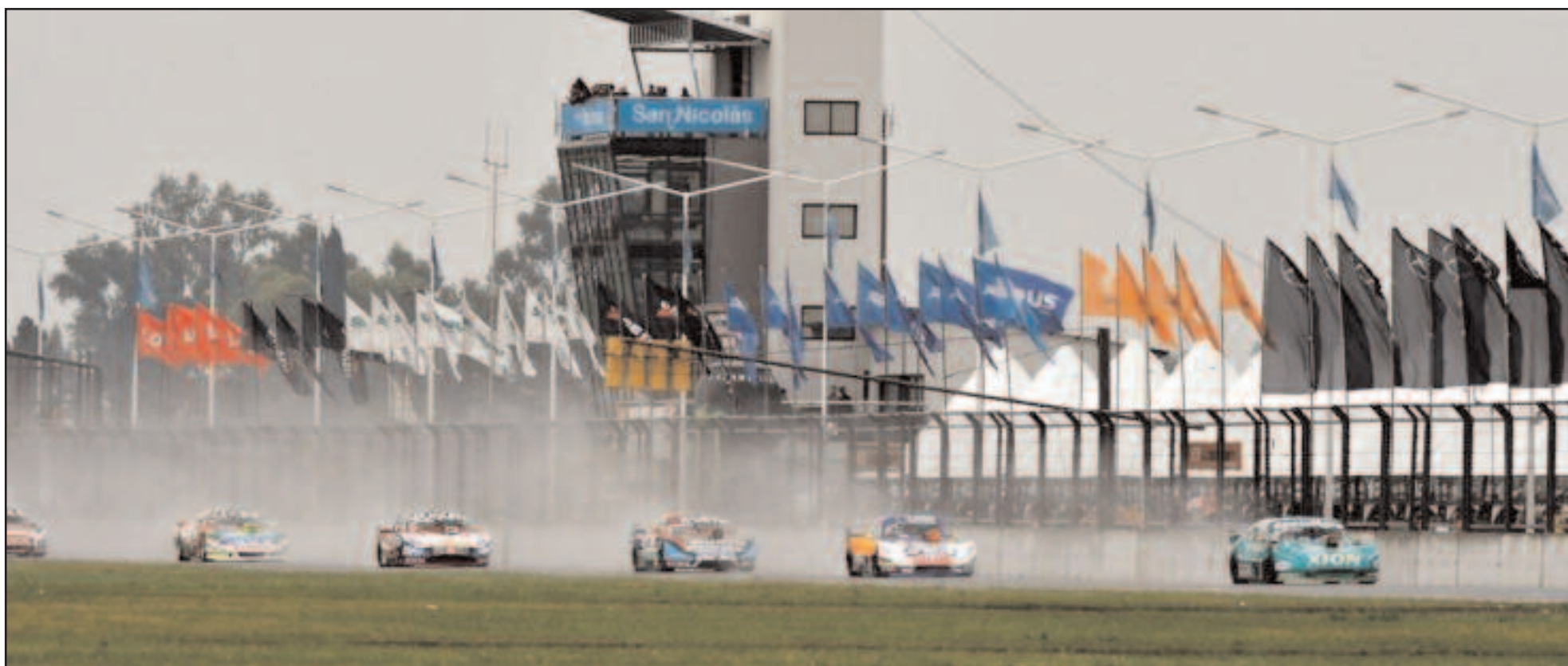
El autódromo de San Nicolás será el escenario de la vuelta del TC.

Tras la frustración en La Plata y en Rafaela (Santa Fe), el TC regresa a San Nicolás