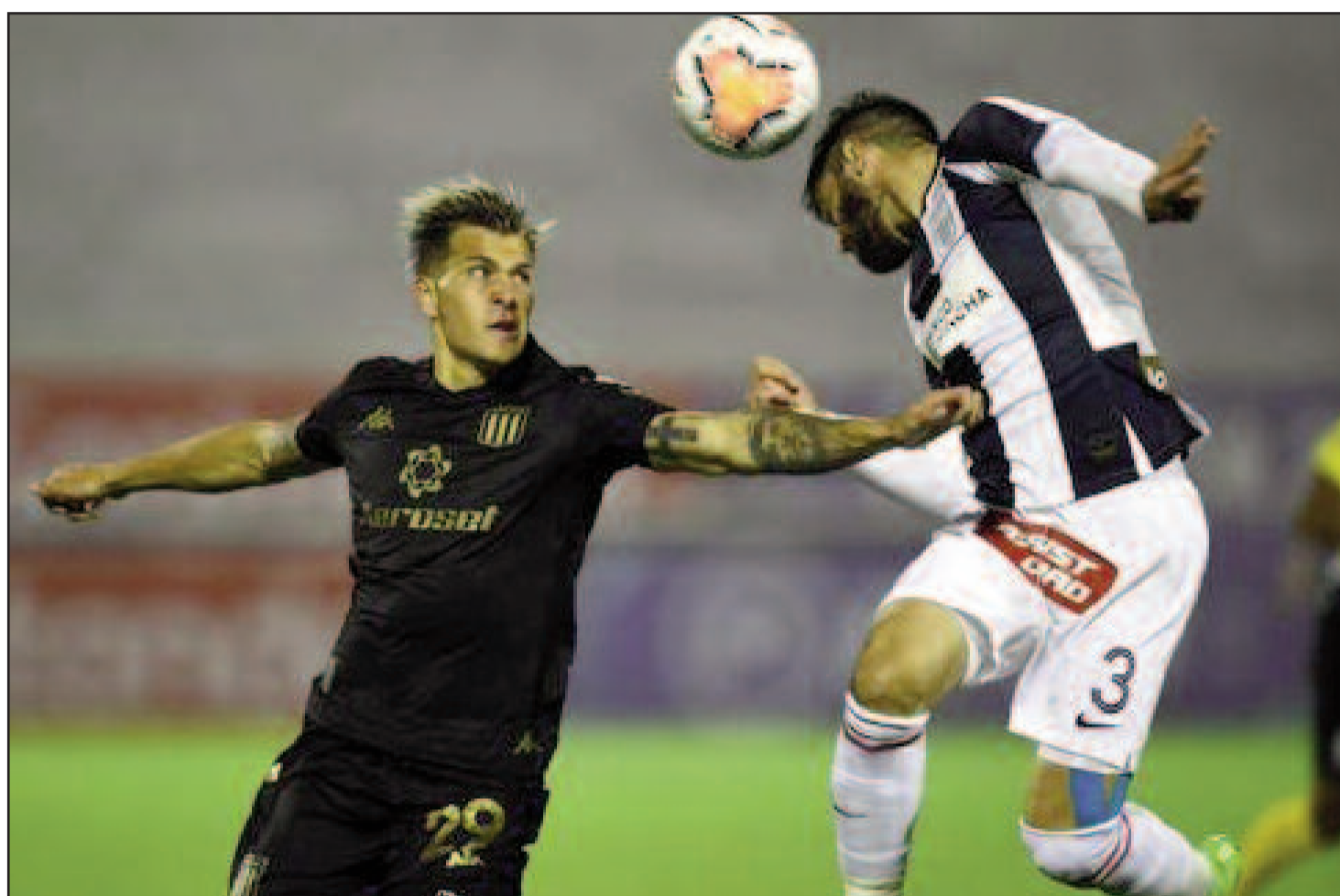
Sobre el final, Racing logró la victoria con goles de Banega y Garré.

Tres puntos muy valiosos para Racing que lo acercan a los octavos de final al conjunto de Sebastián Beccace-