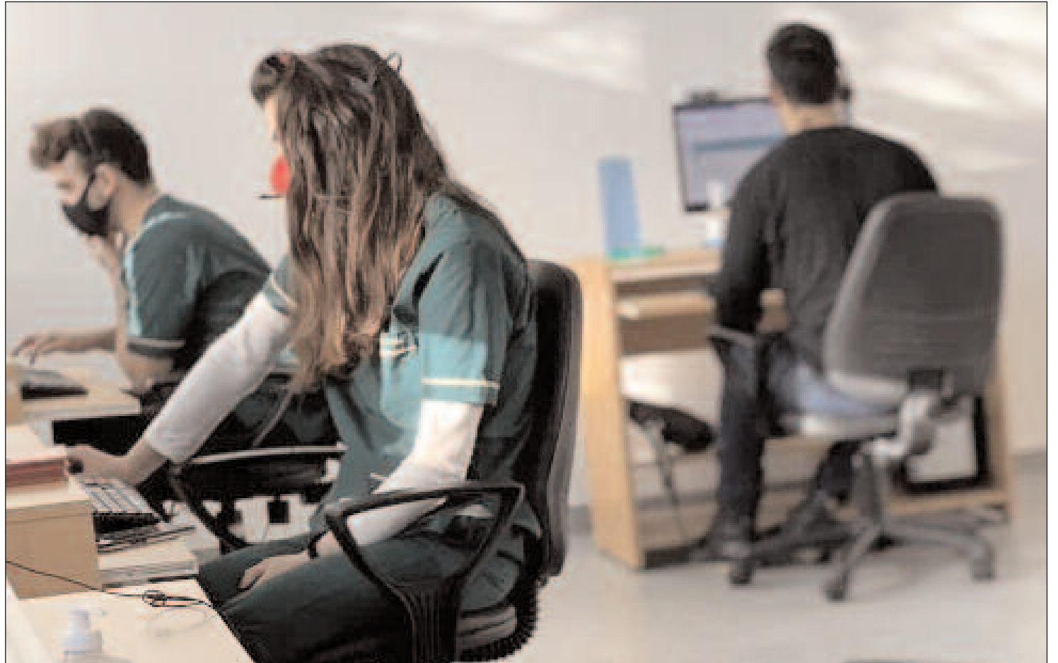
Hay 120 estudiantes de cinco carreras en el Centro de Telemedicina que trabajan de lunes a sábado.

"Estamos haciendo 600 llamados por día. En un mes ya nos vimos desbordados, porque empezamos a funcionar en el momento más crítico en la ciudad. En los últimos días incluso detectamos casos