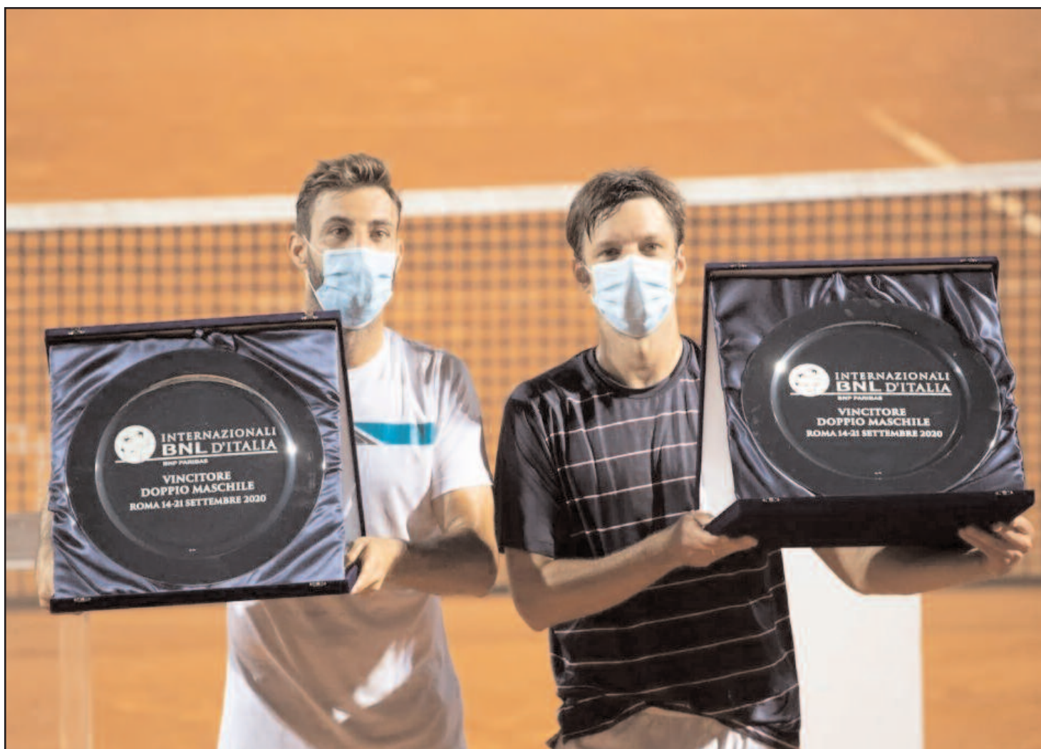
Granollers y Zeballos con sus trofeos en el court romano.