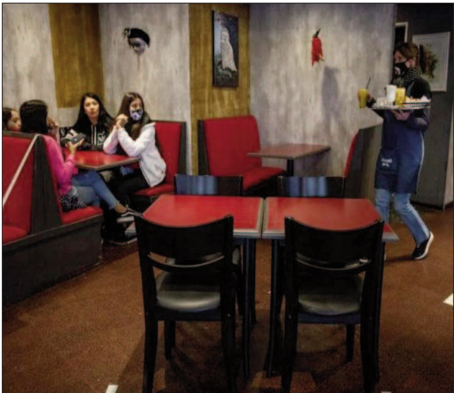
La ocupación del local no deberá superar el 45%

Todas las superficies deben estar permanentemente desinfectadas, y debe haber alcohol en gel o desinfectante en cada una de las mesas. Se recomienda el uso de manteles y servilletas descartables.