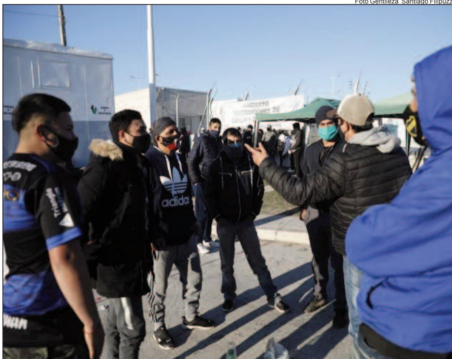
Varios Centros de Distribución que operan para Mercado Libre fueron bloqueados por los camioneros.

Los depósitos de la compañía afectados son los que funcionan en Lanús,