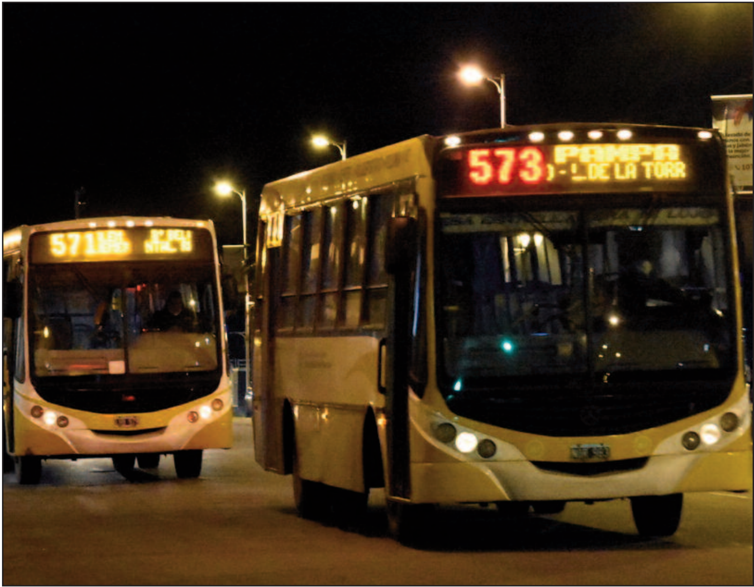
Desde la Agrupación Juan Manuel Palacios calificaron la medida de pro patronal

Sin avances en las negociaciones, el gremio busca presionar para que el Estado gire subsidios a las empresas involucradas.