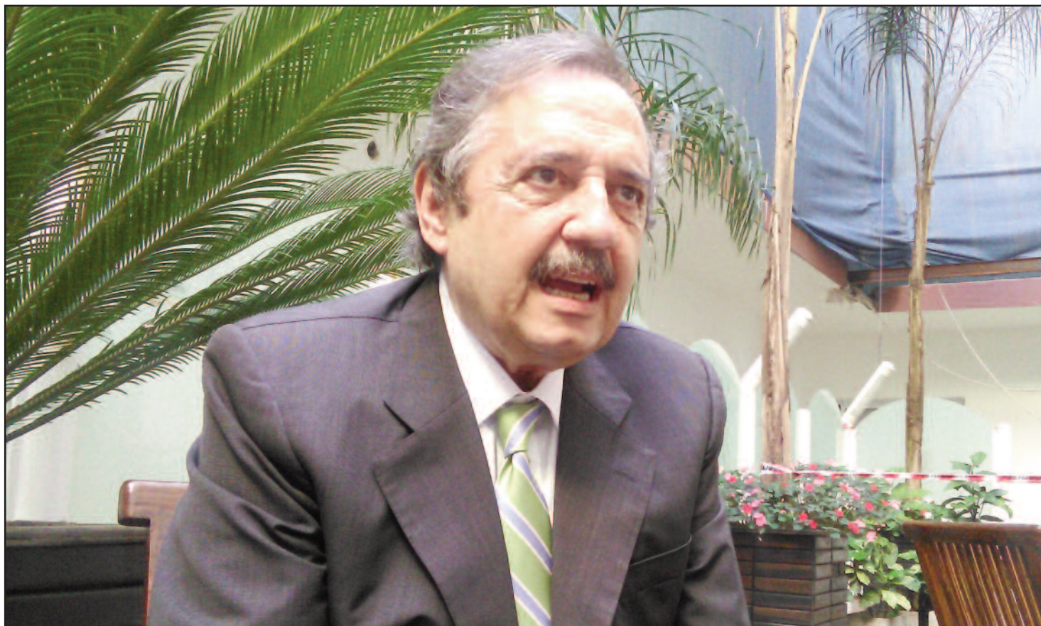
Alfonsín calificó como “preocupante que Vicentin se haya victimizado”, al sostener que “deja el tendal a los argentinos”

“Quieren que el Estado sea un Estado bobo de los argentinos que está para prestar pero no para defender sus acreencias”, preguntó Alfonsín al ser consultado sobre la intervención y el