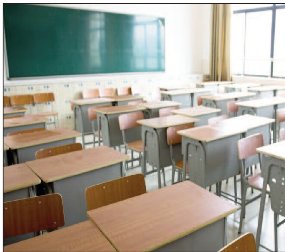
Hay protocolos aprobados para el regreso del ciclo escolar, aunque no hay fecha.

El protocolo marco y los lineamientos federales establecen un conjunto de pautas de trabajo que "promueven un ordenamiento en las actividades inherentes al retorno a las clases presenciales, basadas en criterios sanitarios y salud y seguridad en el trabajo, así como de organización escolar y pedagógica", indicó el Ministerio en un comunicado.