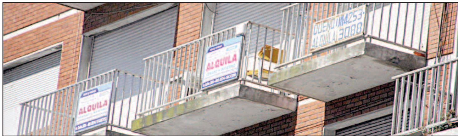
La nueva Ley de Alquileres establece nuevas reglas para los contratos de locación.

La norma fue promulgada por el Ejecutivo nacional y, entre los nuevos beneficios para los inquilinos, dispone el aumento de 2 a 3 años de duración de los contratos