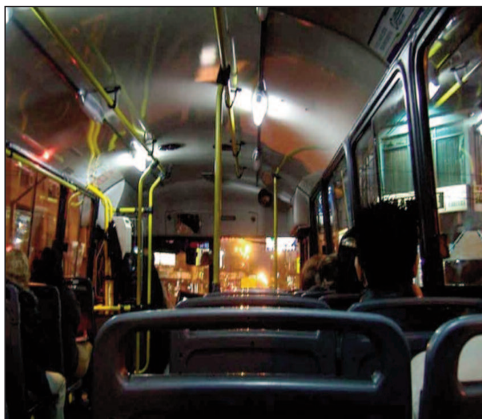
La Cámara Marplatense de Empresas de Transporte Automotor de Pasajeros (Cametap) reclama subsidios nacionales.

Los trabajadores de las líneas 221 y Costa Azul, sin servicio desde el 20 de marzo, sólo cobraron un porcentaje del salario de mayo.