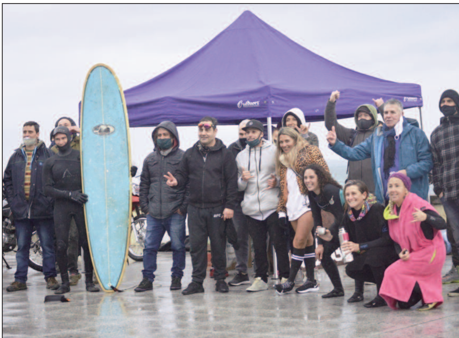
El pedido de intervención de los contenidos de los colegios Fasta generó una gran polémica.

La gobernación mantiene una negativa para que vuelvan las actividades deportivas al aire libre en Mar del Plata. Por ahora solo están autorizadas las salidas recreativas. Y en términos de surf, solo se permitió el entrenamiento a los atletas pro que se preparan para competencias internacionales. Son apenas cuatro los que tienen ese derecho concedido por el gobierno nacional.