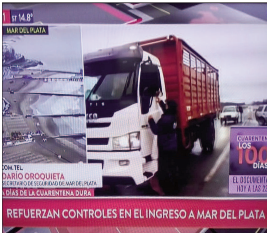
Los medios nacionales de hicieron eco de los controles en los accesos a la ciudad

El trámite vía web es la primera opción que se habilita para los viajeros que deban llegar a Mar del Plata o Batán por razones de fuerza mayor, mientras se trabaja en el diseño y desarrollo de una aplicación que permitirá hacer más ágil esta gestión a tra-