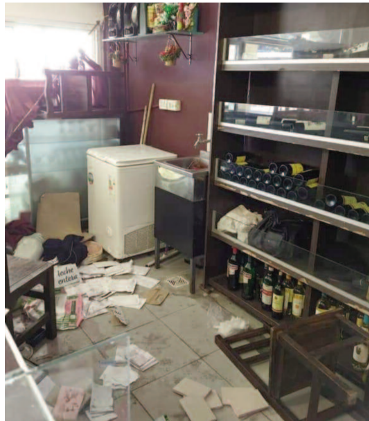
La tradicional Confitería París ubicada en la rambla Casino tuvo que padecer un nuevo robo en medio de la cuarentena por la pandemia.