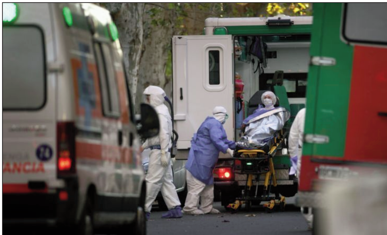
El plan de contingencia provincial, ha generando un fuerte debate en los distritos del interior, ya que existe el temor de que la medida genere contagios en regiones libres de Covid-19.